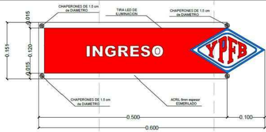
VISTA FRONTAL SEÑAL ETICA