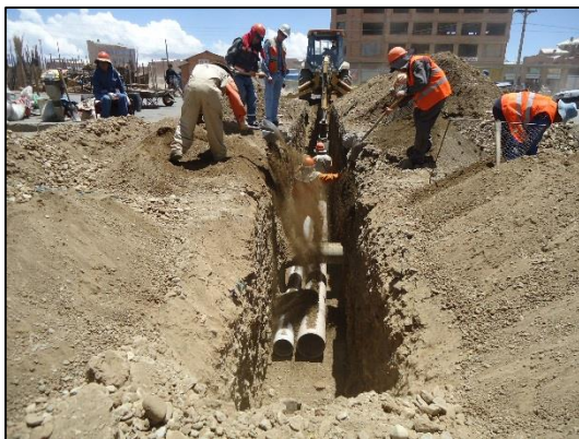
Generación de Partículas suspendidas (polvo)

La empresa deberá presentar un registro fotográfico del regado en zanjas, como respaldo de la mitigación de este impacto, donde se deberá reportar el origen del agua utilizada.