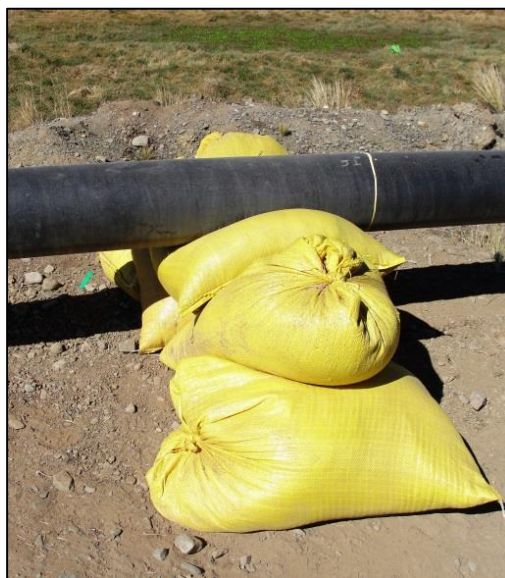
Bolsas de Apoyo para tuberías