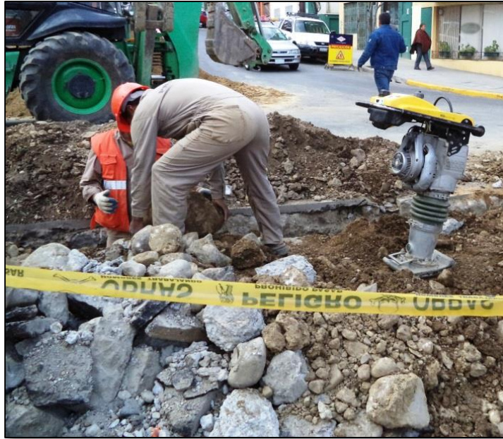
Generación de Escombros

En el trayecto planteado para la red primaria pueden existir áreas urbanizadas con aceras y calzadas, donde la excavación de zanjas generará cantidades significativas de escombros, los mismos que deben ser acomodados cerca de la zanja según la especificación técnica de construcción.