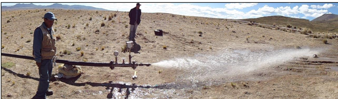
Descarga de agua en prueba hidráulica

La empresa deberá presentar un informe donde se indique la fuente y cantidad de agua utilizada para la prueba o pruebas hidráulicas, el cronograma de las pruebas y el análisis de laboratorio e interpretación de resultados además de incluir un reporte fotográfico de la actividad donde se encuentren fotografías de la fuente y del punto de descarga, así como de la toma de muestras para laboratorio.