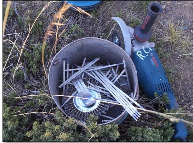
Restos de Varillas de soldar