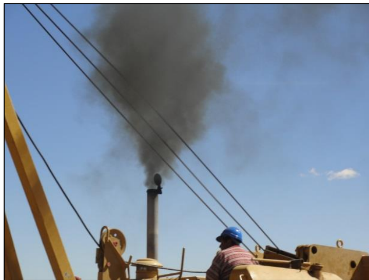
Emisión de gases de combustión

La empresa deberá presentar planillas o registros del último mantenimiento realizado a cada vehículo y maquinaria pesada para respaldar el control de emisión de contaminantes y que puedan estar dentro de los límites permisibles establecidos en el Reglamento en Materia de Contaminación Atmosférica de la ley 1333 de medio ambiente. El personal ambiental de YPFB realizará oportunamente monitoreos ambientales mediante la medición de gases de combustión en maquinarias y vehículos.