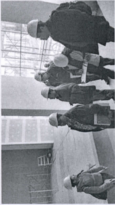
RECONOCIMIENTO DEL AUDITORIO Y MEZZANINE