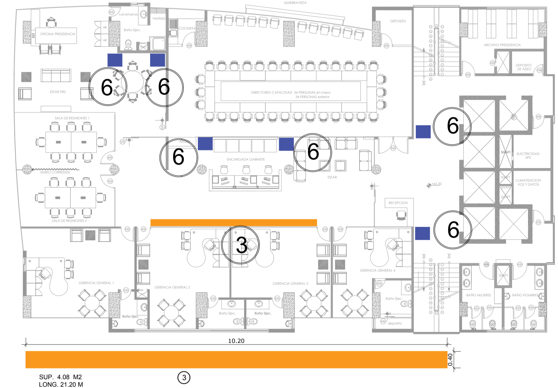
PISO 16 - PRESIDENCIA