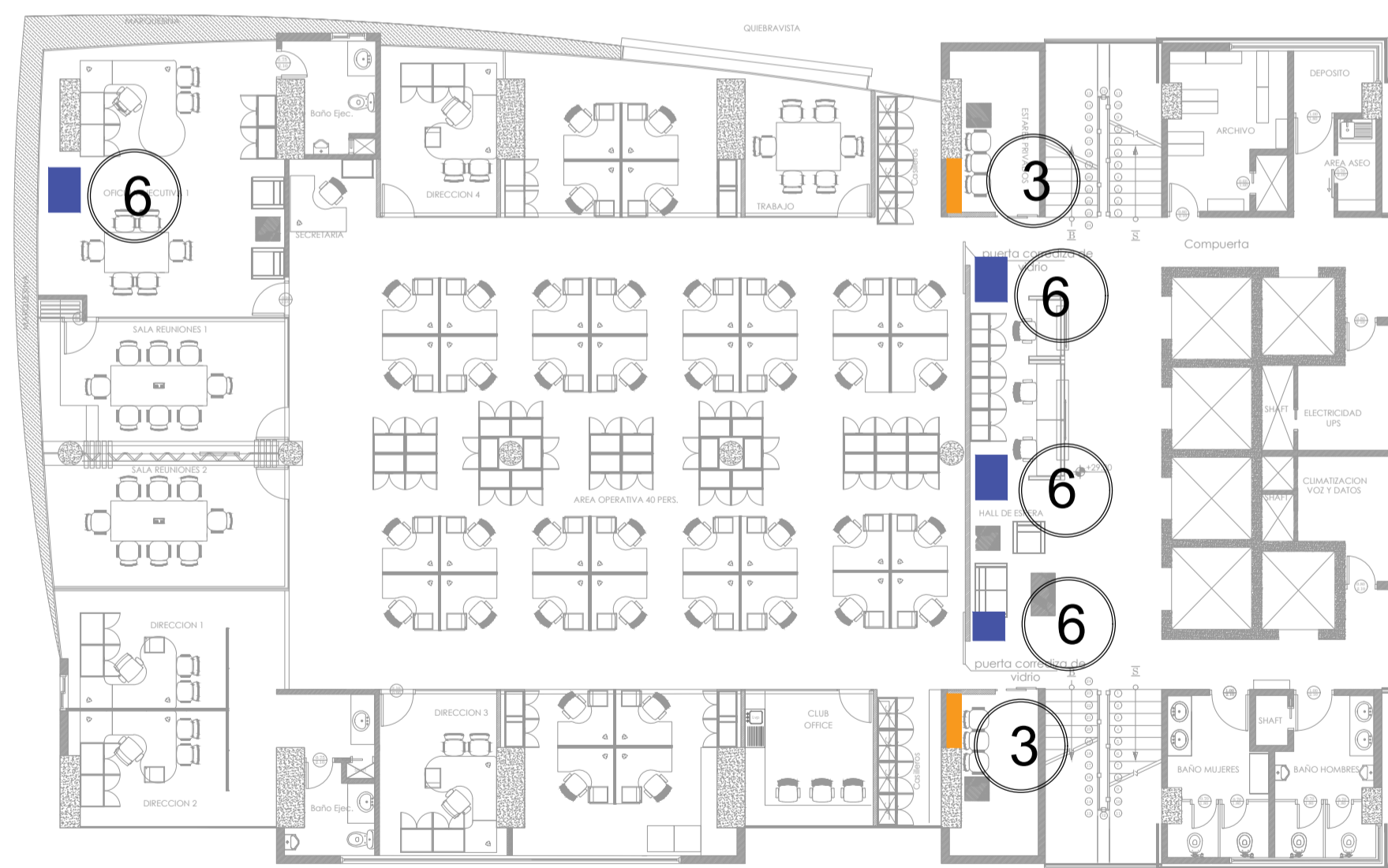
OFICINAS TIPO 6-15