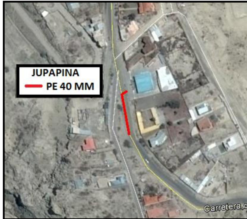
IMAGEN SATELITAL

VISTA SATELITAL DE LA TRAYECTORIA DE LA RED SECUNDARIA