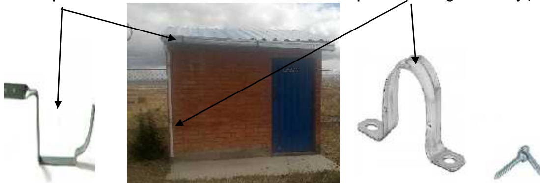
Abrazadera para tubo desagüe o drenaje,