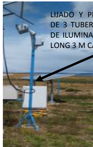
LIJADO Y PINTADO COLOR AZUL DE 3 TUBERIA A.G. DEL SOPORTE DE ILUMINACIÓN DE 1 1/2" DN, LONG 3 M CADA PIEZA