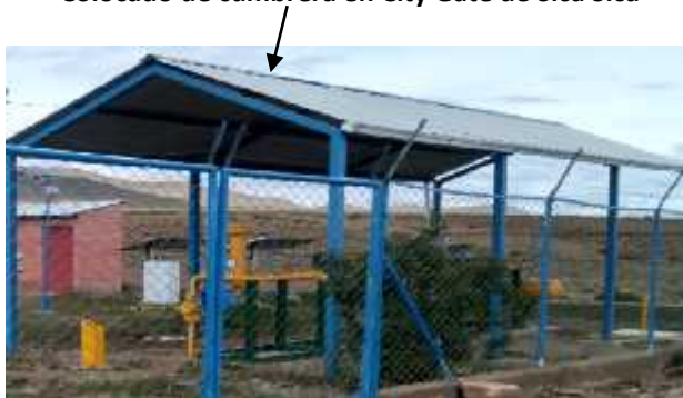
Colocado de cumbrera en City Gate de Sica Sica

Posterior a este trabajo, la empresa contratista debe proceder al pintado de estas superficies con pintura color azul y color blanco que serán autorizadas y aprobadas por el supervisor de YPFB, el criterio de la aprobación de este ítem se dará cuando el supervisor verifique el pintado del 100 % de las piezas.