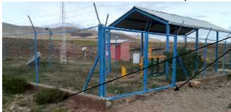
Predio de City Gate de SICA SICA

Construcción de acera H° S° exterior del City Gate