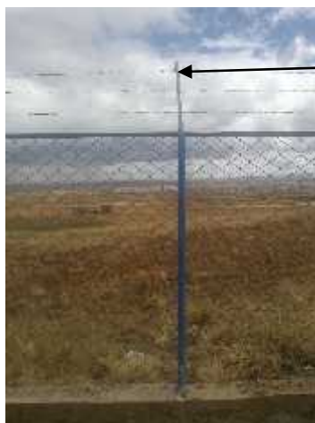
Perfil Acero Angular en "T" de enmallado perimetral