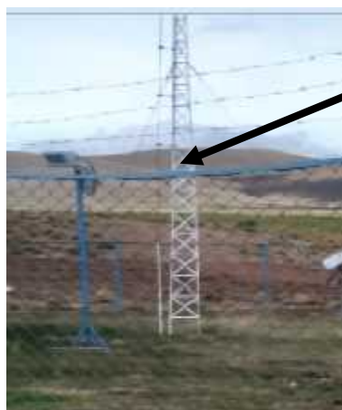
TUBERÍA A.G. DE ESTRUCTURA DE PARA RAYOS 1/2" DN, LONG TOTAL 110 M