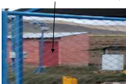
Puerta de la caseta de control eléctrico en el City Gate

Posterior a este trabajo, la empresa contratista debe proceder al pintado de estas superficies con pintura color azul, que serán autorizadas y aprobadas por el supervisor de YPFB, el criterio de la aprobación de este ítem se dará cuando el supervisor verifique el pintado del 100 % de la puerta.