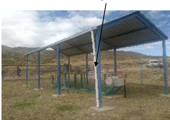
Colocado de tubo de desagüe de 4 " DN A.G.

La empresa contratista deberá proveer e instalará los tubos de drenaje de 4" de D N en acero galvanizado (A. G.), misma que tenga una longitud de 6 metros lineales, este trabajo se debe realizar en el tinglado del City Gate, esta será autorizada y aprobada por el supervisor de YPFB, a continuación se muestra una imagen que represente dicha actividad.