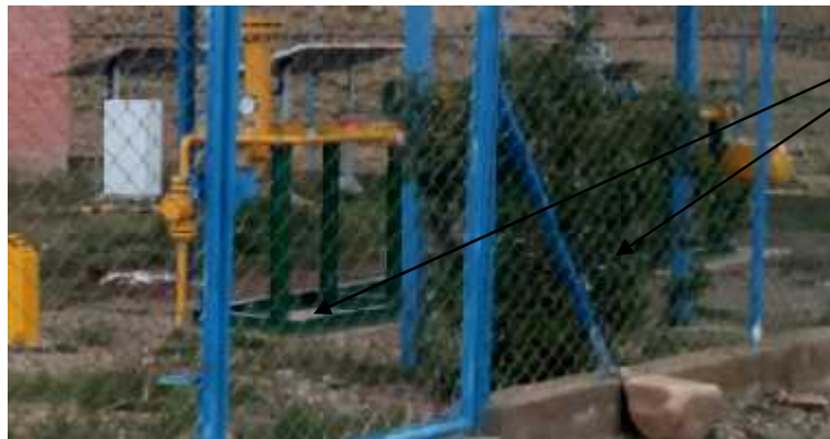
BASES DE CEMENTO DE CITY GATE (1 PIEZA)

El criterio de la aprobación de este ítem se dará cuando el supervisor verifique el pintado del 100 % de las piezas.