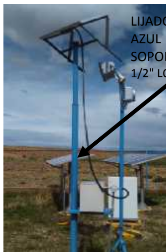
LIJADO Y PINTADO COLOR AZUL DE 1 TUBERIA A.G. DEL SOPORTE PANEL SOLAR DE 2 1/2" LONG 2,76 M