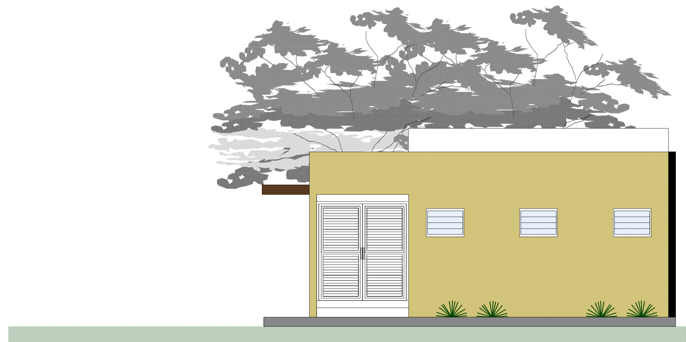
FACHADA LATERAL DERECHA ESCALA:1:50