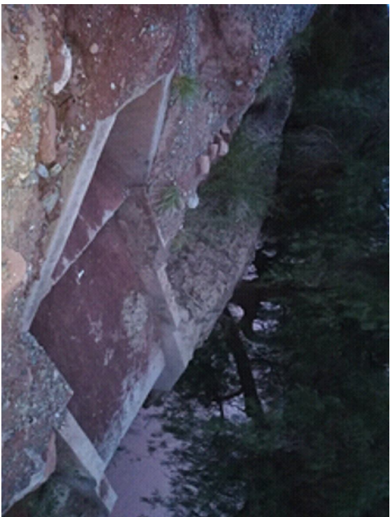
TUBERIA ENFUNDADA VISTA (ENTRE 3+850 Y 3+900)