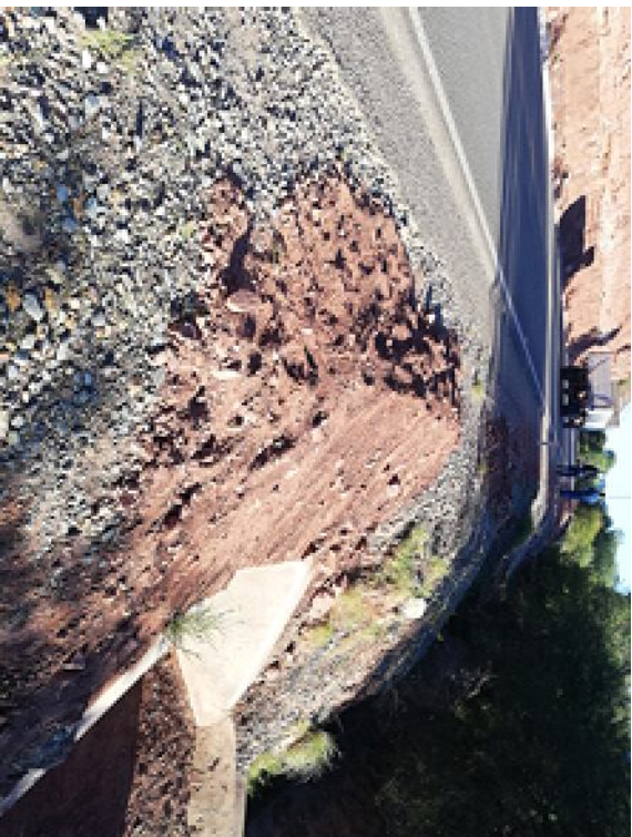
TUBERIA ENFUNDADA VISTA (ENTRE 3+950 Y 4+000)