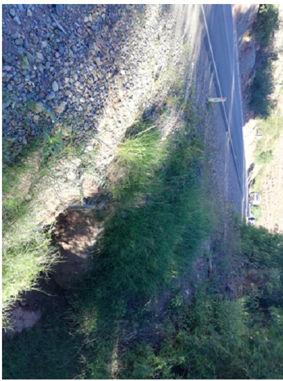
TUBERIA ENFUNDADA VISTA (4+400 Y 4+450)