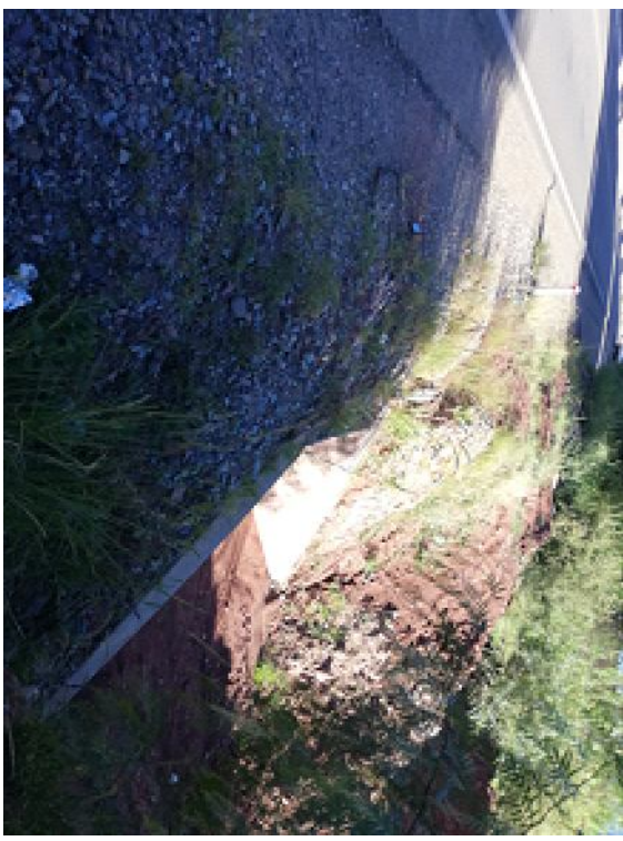
TUBERIA ENFUNDADA VISTA (4+500)