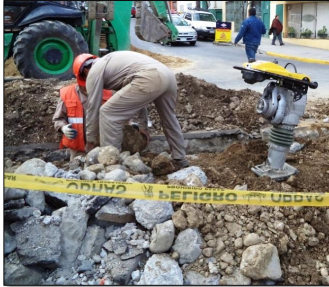
Generación de Escombros

El trayecto planteado para las redes secundarias son en su mayoría sobre áreas urbanizadas con aceras y calzadas, donde la excavación de zanjas generará cantidades significativas de escombros, los mismos que deben ser acomodados cerca de la zanja según la especificación técnica de construcción.